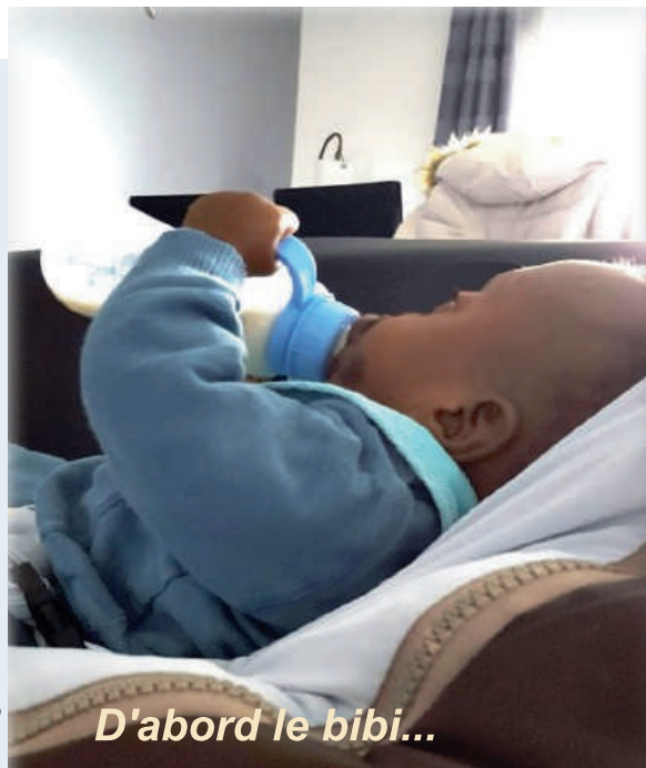
D'abord le bibi...

Chaque instant est inoubliable. Chaque regard, chaque gazouillis nous font oublier les moments difficiles.