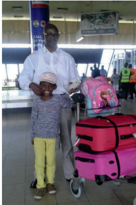
Keita au Burundi