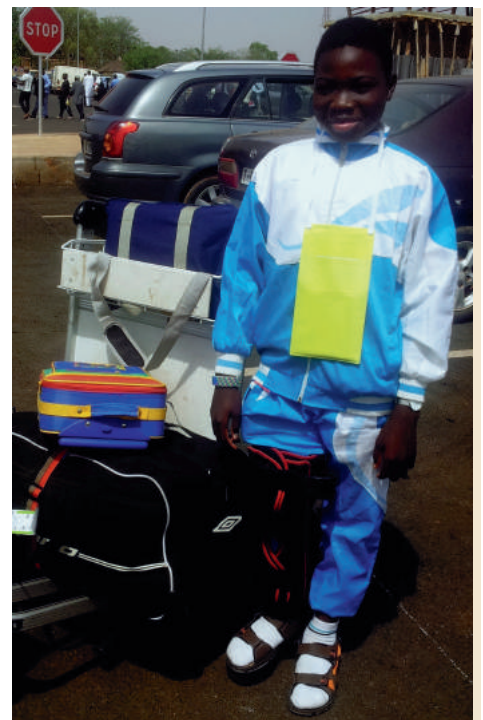
Panworo au Mali