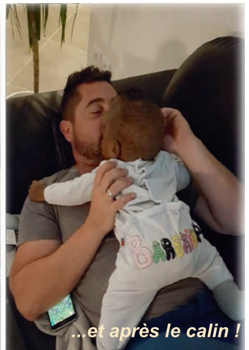
...et après le calin !

Il n'y a pas de mot pour dire à quel point cette aventure est merveilleuse et gravée dans nos cœurs à jamais