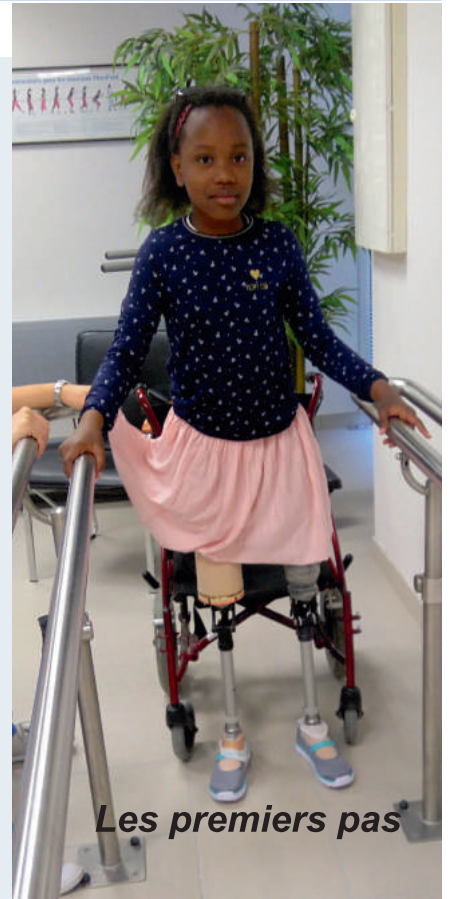
Les premiers pas