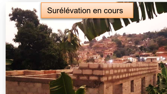
Surélévation en cours