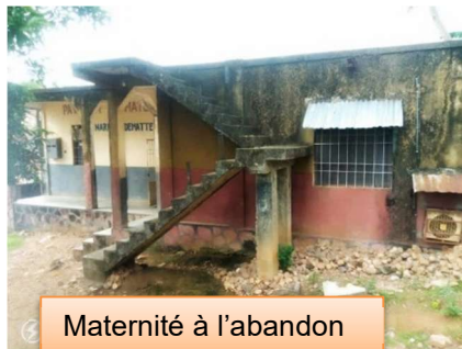
Maternité à l'abandon

Total : 5 000€ en 2025 (sur 12 019€ de soutien prévu)