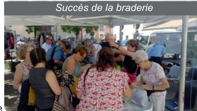
Succès de la braderie

qui, de l'aube à tard dans la nuit, travaillent à la réussite de cette fête.