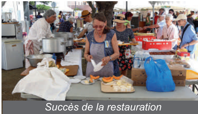
Succès de la restauration

C'est aussi une belle fête pour les nombreux bénévoles d'Espoir pour un Enfant qui se rassemblent à cette occasion et