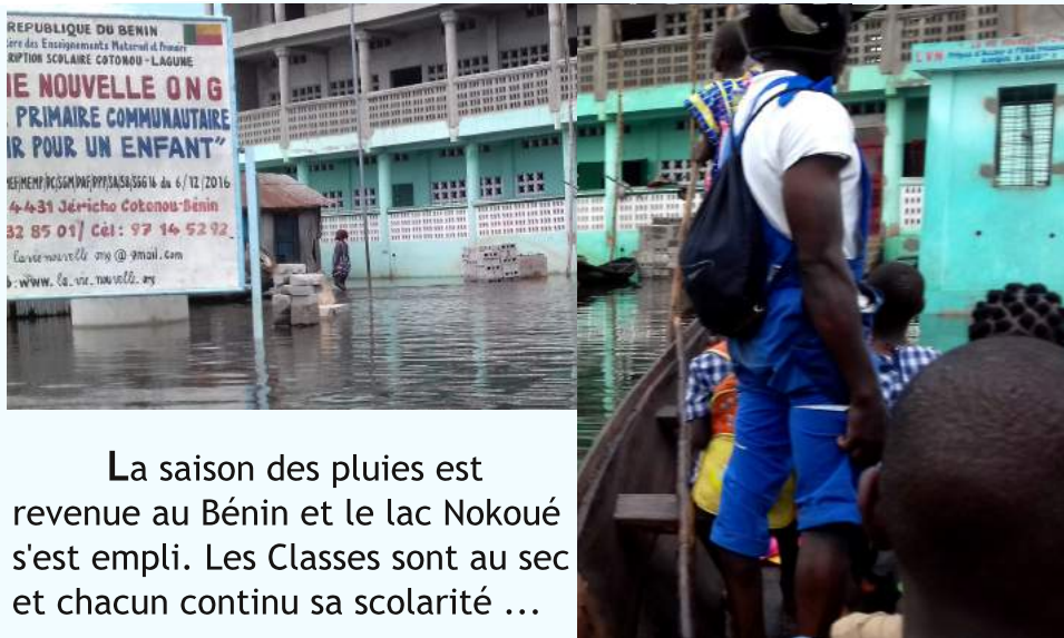
La saison des pluies est revenue au Bénin et le lac Nokoué s'est empli. Les Classes sont au sec et chacun continue sa scolarité ...