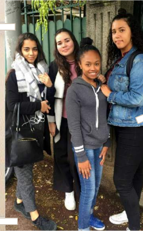
Les copines !