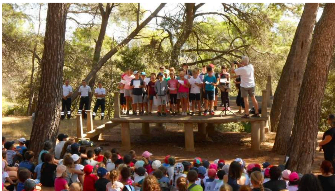
Journées éco-citoyennes sous les pins de Saint-Christophe.

Nous remercions chaleureusement la mairie de Puisserguier pour l'aide logistique, les pompiers pour leur participation active, les lycéens de la classe de terminale SAPAT du lycée des Buissonnets de Capetang pour leur soutien efficace à l'animation et, bien sûr, tous les bénévoles qui ont répondu présents pour l'animation des ateliers et le joyeux déroulement de ces 2 journées.