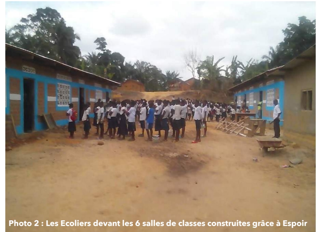
Photo 2 : Les Ecoliers devant les 6 salles de classes construites grâce à Es-poir