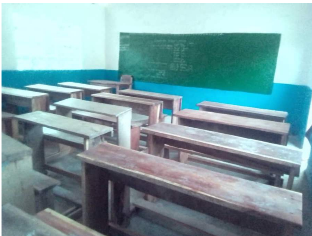
Photo 4 : L'ensemble du mobilier a également été financé par Espoir

Nous avons donc pris la décision de détruire et de reconstruire cette école. Le résultat est très satisfaisant comme le montrent les photos.