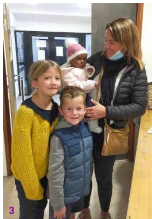
Photo 3 : Petit tour à la braderie d'Espoir à Gigan le 12 novembre